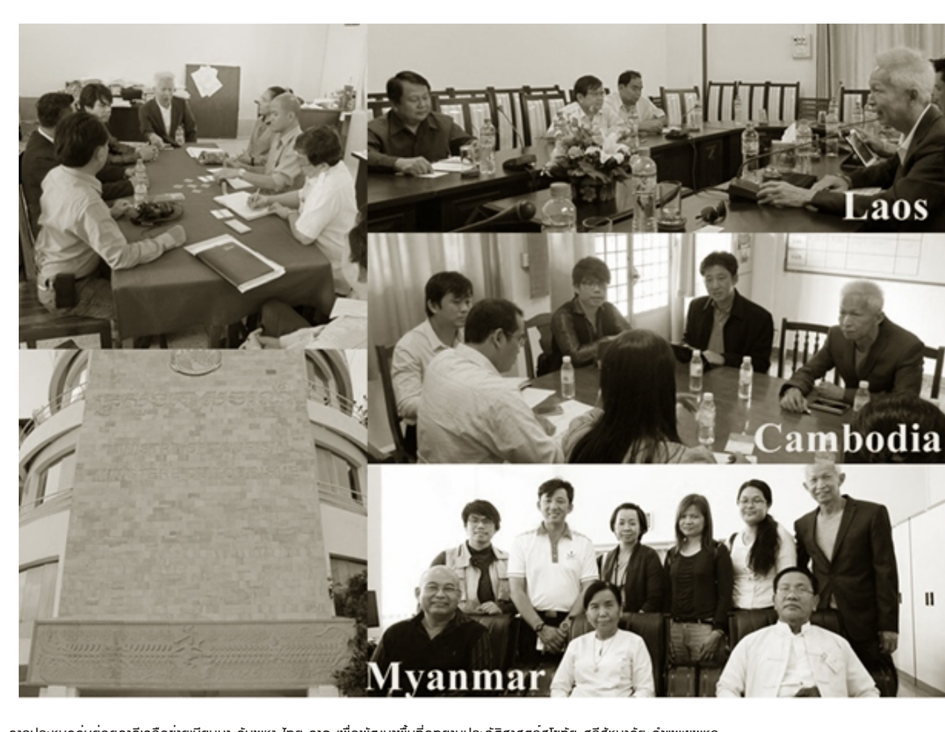
การประชุมและแลกเปลี่ยนเรียนรู้ระหว่างประเทศในกรอบของโครงการนำพหุแบบการท่องเที่ยวเชิงสร้างสรรค์ของพื้นที่พิเศษอุทยานประวัติศาสตร์สุโขทัย-ศรีสัชนาลัย-กำแพงเพชร

เพื่อให้แนวทางการพัฒนาอุทยานประวัติศาสตร์สุโขทัย-ศรีสัชนาลัย-กำแพงเพชร ตลอดจนพื้นที่ต่อเนื่องโดยรอบเป็นไปอย่างมีประสิทธิภาพ มีความสามารถและกลไกการอนุรักษ์ที่สอดคล้องกับวิถีชีวิตของชุมชนทุกระดับ ทั้งชุมชนประวัติศาสตร์ ชุมชนวัฒนธรรม ชุมชนตลาด และชุมชนริมน้ำ เสริมสร้างการพัฒนา เศรษฐกิจและการท่องเที่ยวเชิงสร้างสรรค์โดยภาคประชาชนมีส่วนร่วมทุกระดับการพัฒนา เพื่อให้ได้เกิด การพัฒนาอย่างยั่งยืนที่สอดคล้องกับยุทธศาสตร์ระดับชาติจนถึงระดับท้องถิ่น ต่อเนื่องไปจนถึง การเชื่อมโยงแหล่งท่องเที่ยวมรดกโลกกับประเทศเพื่อนบ้านเพื่อให้เกิดการรวมกลุ่มการท่องเที่ยวเป็นแกน แหล่งมรดกประวัติศาสตร์วัฒนธรรมและสถาปัตยกรรม โดยพัฒนาศักยภาพให้ประเทศไทยเป็นศูนย์กลาง มรดกโลกกลุ่มอาเซียน (World Heritage Cluster "ASEAN") สร้างความตระหนักและให้ความสำคัญต่อการอนุรักษ์และฟื้นฟูทรัพยากรการท่องเที่ยวมรดกวัฒนธรรมให้คงไว้ซึ่งความมีคุณค่าสืบต่อไปในอนาคต