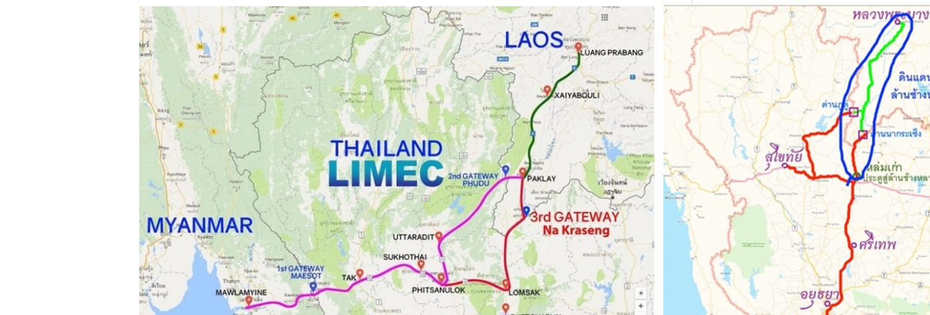
Luangprabang-Indochina-Mawlamyine Economic Corridor (LIMEC) ระเบียงเศรษฐกิจ ลาวพหุเมฆง อินโดจีน เม้าะลาโอ The 3rd Gateway of LIMEC First Gateway บริเวณถนนพหลโยธิน มุ่งมาด อ.เมสยา ๑.๓๓ กับจังหวัดเมสยา สภากาพิเศษเมสยา Second Gateway ถนนอุฎฐดิตถ์ กับ แขวงบูธศรี สบ.ลาว ซึ่งสามารถเดินทางไปยังเมืองหลวงของลาว Third Gateway อ่างกตกที่ จังหวัดสรวง สอดคล้องกับทางหลวงหมายเลข 4๐๐ของลาวลาว โดยจะนำเข้าสู่ระบบถนนทางไปเมืองอินโดจีนด้านเมืองหลวงของลาว อินโดจีนประเทศอินโดจีน ๑ เพื่อการเชื่อมโยงกับพื้นที่ทางตอนใต้ของลาวและจีน